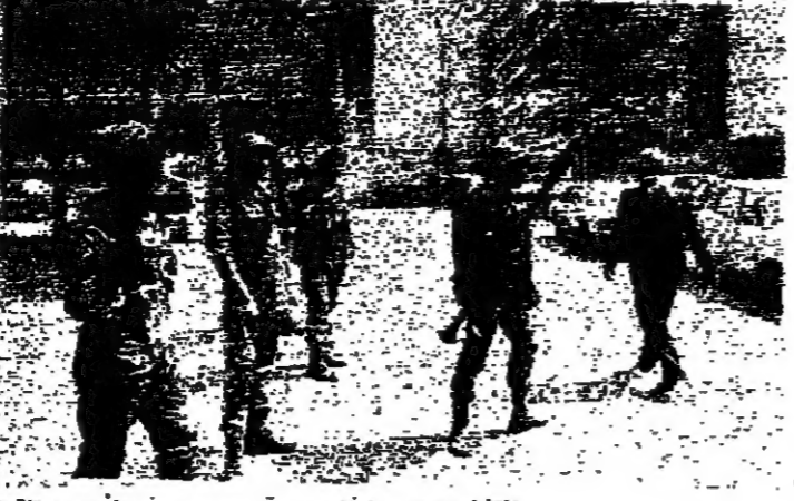
انتشار سوري في الحمرا